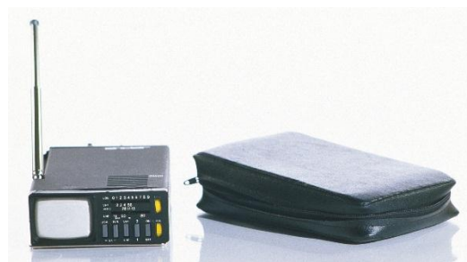
Téléviseur Microvision MTV-1 Sinclair, Royaume-Uni, 1980.